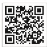
iOS / Android 2合1