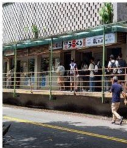
樂活小舖日式早午餐