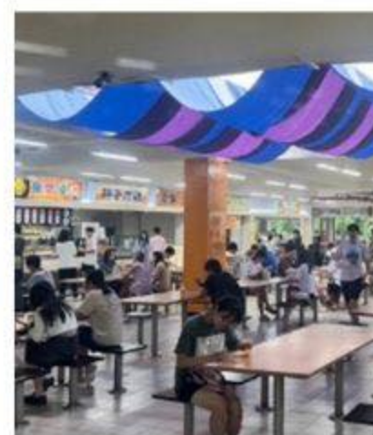
自強九舍安九食堂