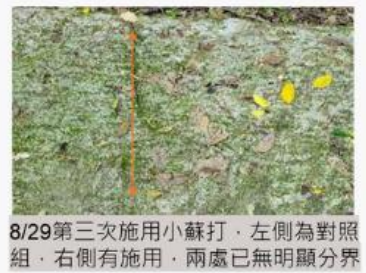
8/29第三次施用小蘇打，左側為對照組，右側有施用，兩處已無明顯分界