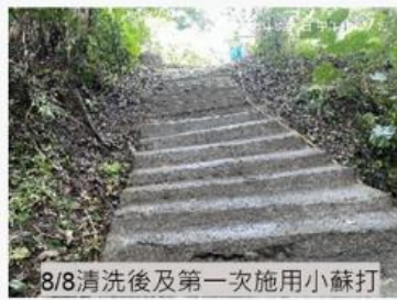
8/8清洗後及第一次施用小蘇打