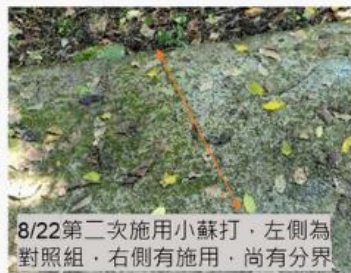
8/22第二次施用小蘇打，左側為對照組，右側有施用，尚有分界